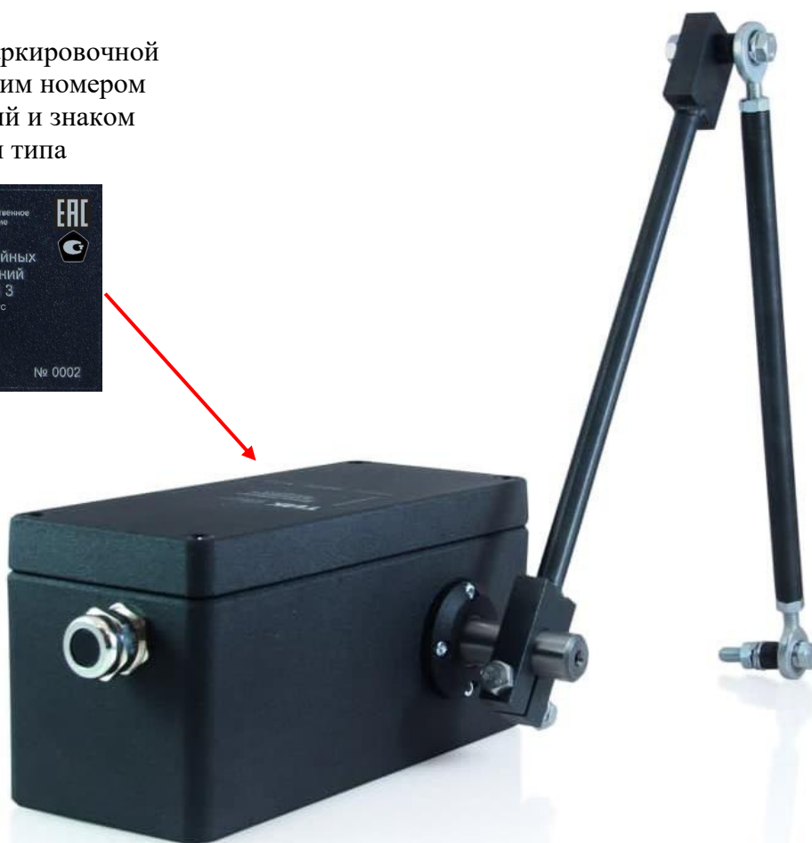
Рисунок 2 – Общий вид датчиков линейных перемещений ТИК-ДЛП 3